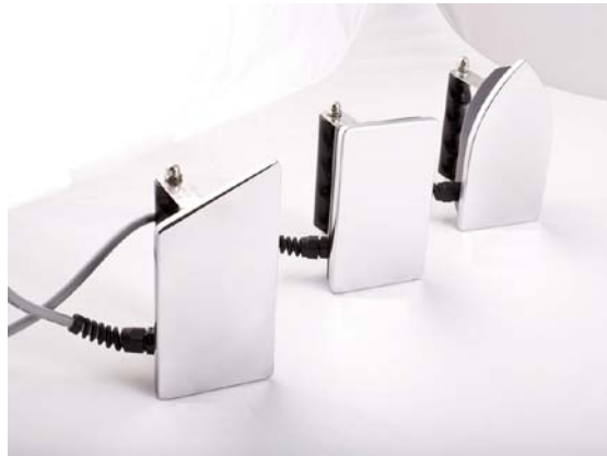
Блоки управления (контроллеры)